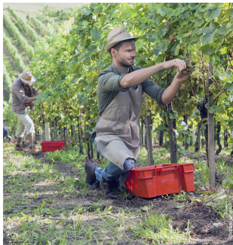
Un guide de dix bonnes pratiques sera distribué à partir du mois de juillet aux viticulteurs.

1. L'étude a été menée par Vignerons Engagés, l'agence RSE Croissance bleue et le laboratoire Lapa-Research.